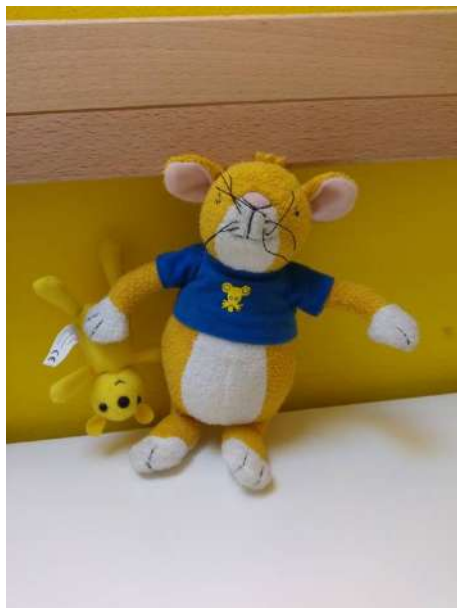
Topo Tip per l'italiano

Per differenziare ed identificare le DIVERSE LINGUE a ciascuna di esse è stato associato un PERSONAGGIO.