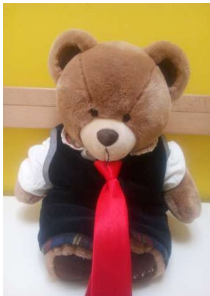
Ors Tita per il ladino