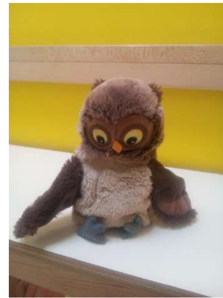
Honey the Owl per l'inglese