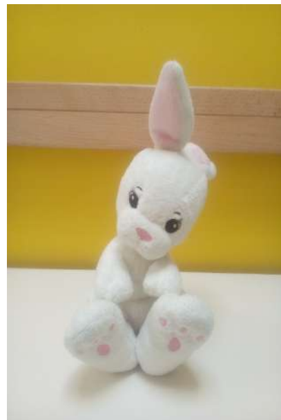
Hase Otto per il tedesco